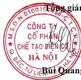
Bùi Quang Vinh