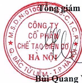
Bùi Quang Vinh