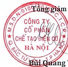
Bùi Quang Vinh